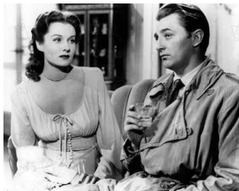
1948 LA GRIFFE DU PASSÉ (Out of the Past) de Jack Tourneur avec Robert Mitchum