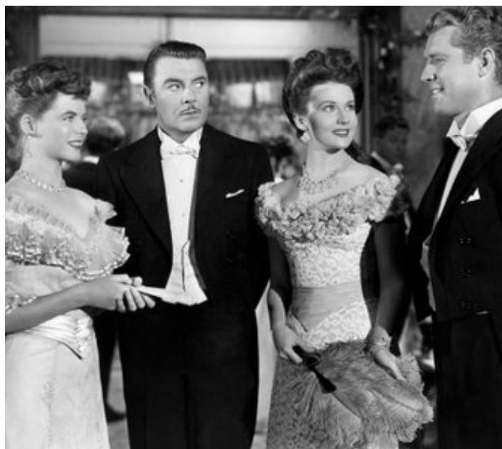
1946 DEUX MAINS DANS LA NUIT (The Spiral Staircase) de Robert Siodmak avec George Brent, Dorothy MacGuire et Gordon Oliver