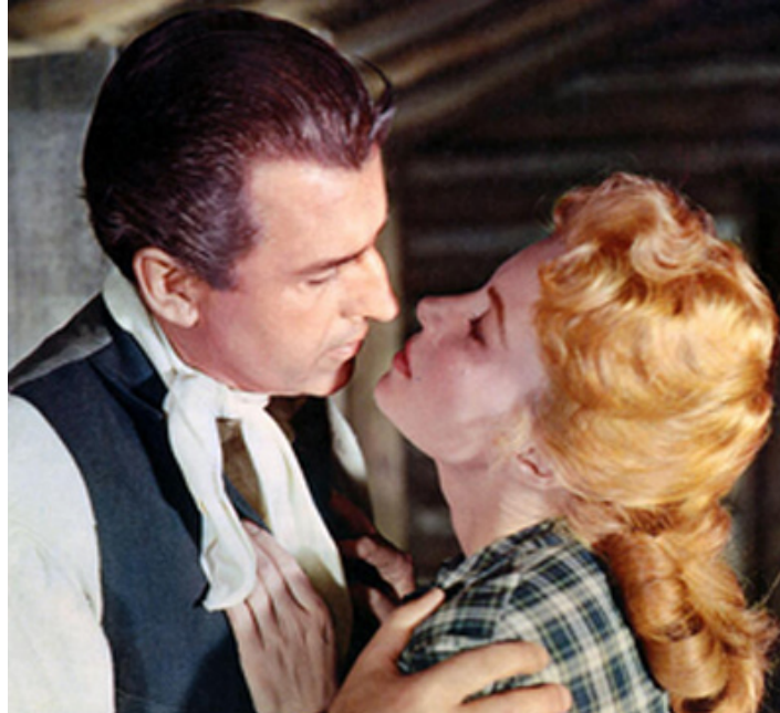
1957 TERREUR DANS LA VALLÉE (Gun Glory) de Roy Rowland avec Stewart Granger