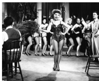
1953 THOSE REDHEADS FROM SEATTLE de Lewis R. Foster