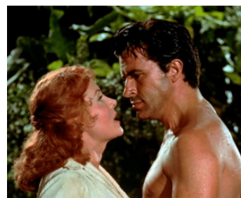
1954 L'APPEL DE L'OR (Jivaro) d'Edward Ludwig avec Fernando Lamas