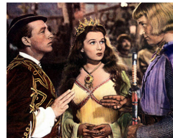
1949 UN YANKEE À LA COUR DU ROI ARTHUR (A Connecticut Yankee) avec Bing Crosby