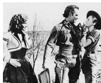
1953 LE TRIOMPHE DE BUFFALO BILL (Pony Express) de Jerry Hopper avec Charlton Heston