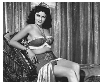
1951 LA DANSE INFERNALE (Little Egypt) de Frederick de Cordova