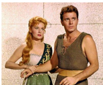
1960 LA RÉVOLTE DES ESCLAVES (La Rivolta degli schiavi) de N. Malasomma avec L. Jeffries