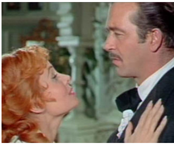
1955 LE MARIAGE EST POUR DEMAIN (Tennessee's Partner) d'Allan Dwan avec John Payne