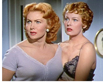
1956 DEUX ROUQUINES DANS LA BAGARRE (Slightly Scarlet) d'A. Dwan avec Arlene Dahl