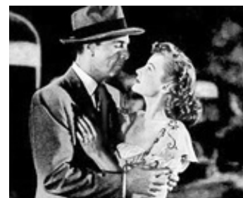
1951 L'IMPLICABLE (Cry Danger) de Robert Parrish avec Dick Powell