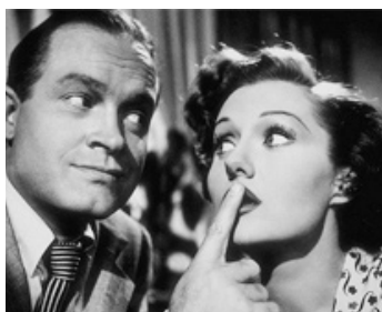
1949 LE DON JUAN DE L'ATLANTIQUE (The Great Lover) d'Alexander Hall avec Bob Hope