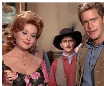
1969 BACKTRACK d'Earl Bellamy avec Neville Brand et Doug McClure