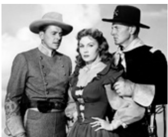
1949 LE DERNIER BASTION (The Last Outpost) de Lewis Foster avec Bruce Bennett