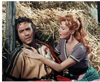
1955 SÉMIRAMIS, ESCLAVE ET REINE de Carlo L. Bragaglia avec Ricardo Montalban