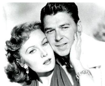
1953 SOUS LES TROPIQUES (Tropic Zone) de Lewis R. Foster avec Ronald Reagan