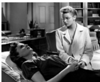
1945 LA MAISON DU DR EDWARDES (Spellbound) d'Alfred Hitchcock avec Ingrid Bergman