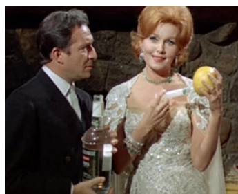
1967 MES FEMMES AMÉRICAINES (Una moglie americana) de G. Polidoro avec Ugo Tognazzi