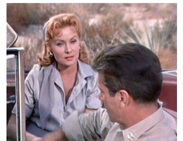
1960 ALERTE EN PLEIN CIEL (The Crowded Sky) de Joseph Pevney avec Efrim Zimbalist Jr