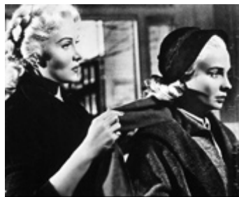
1958 RETOUR AVANT LA NUIT (Home before Dark) de Mervyn Le Roy avec Jean Simmons