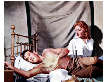
1958 LA FEMME AU FOUET (Bullwhip) de Harmon Jones avec Guy Madison