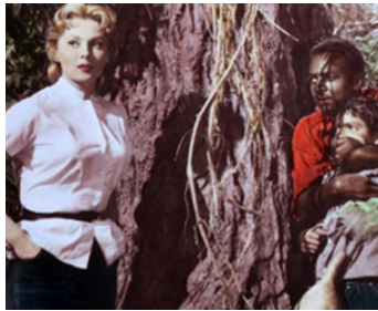
1956 ODONGO (Odongo) de John Gilling avec Earl Cameron