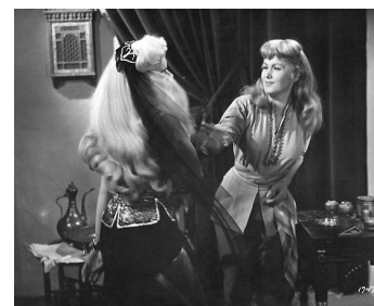
1954 YANKEE PACHA de Joseph Pevney