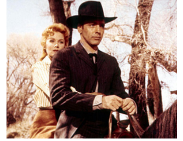
1957 RÈGLEMENT DE COMPTE À OK CORRAL (Gunfight at OK Corral) de John Sturges