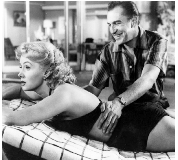
1956 LA CINQUIÈME VICTIME (While the City Sleeps) de Fritz Lang avec Vincent Price