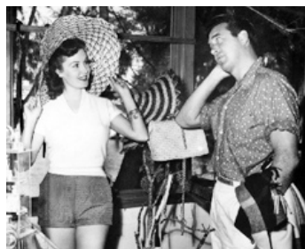
1951 L'OR DE LA NOUVELLE-GUINÉE (Crosswinds) de Lewis Foster avec John Payne