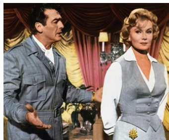
1959 LE CIRQUE INFERNAL (The Big Circus) de Joseph Newman avec Victor Mature