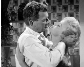
1956 LE TUEUR S'EST ÉVADÉ (The Killer is loose) de Bud Boetticher avec Joseph Cotten