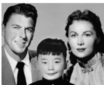
1952 HONG-KONG (Hong-Kong) de Lewis R. Foster avec Ronald Reagan