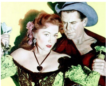
1951 TÊTE D'OR ET TÊTE DE BOIS (The Redhead and the Cowboy) de L. Fenton avec Glenn Ford