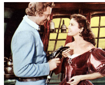
1952 LE FAUCON D'OR (The Golden Hawk) de Sidney Salkow avec Sterling Hayden