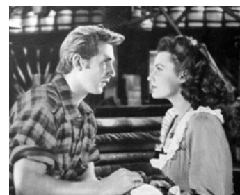
1946 LES PIONNIERS D'ABILENE (Abilene Town) de Edwin Marin avec Lloyd Bridges