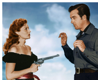
1950 L'AIGLE ET LE VAUTOUR (The Eagle and the Hawk) de L. Foster avec John Payne