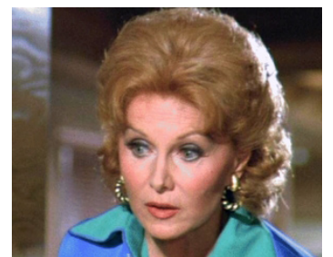
1980 LE PLUS SECRET DES AGENTS SECRETS (The Nude Bomb) de Clive Donner