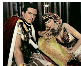
1953 LE SERPENT DU NIL (Serpent of the Nile) de William Castle avec Raymond Burr